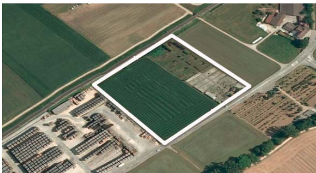
Site d'implantation à la Haute-Sorne.

De nombreux citoyens et membres de Pro Natura Jura nous interpellent régulièrement. Deux membres ont démissionné pensant que nous suivions toujours le projet. Le groupe d'accompagnement auquel nous avons participé est en suspens depuis longtemps. Nos députées ont annoncé en 2014 qu'elles ne voulaient pas participer à d'autres groupes. Notre association a clairement annoncé qu'elle n'intégrerait pas d'autres structures relatives à ce dossier. Nous nous distinguons nettement sur ce point d'autres associations présentes dans le groupe d'accompagnement.