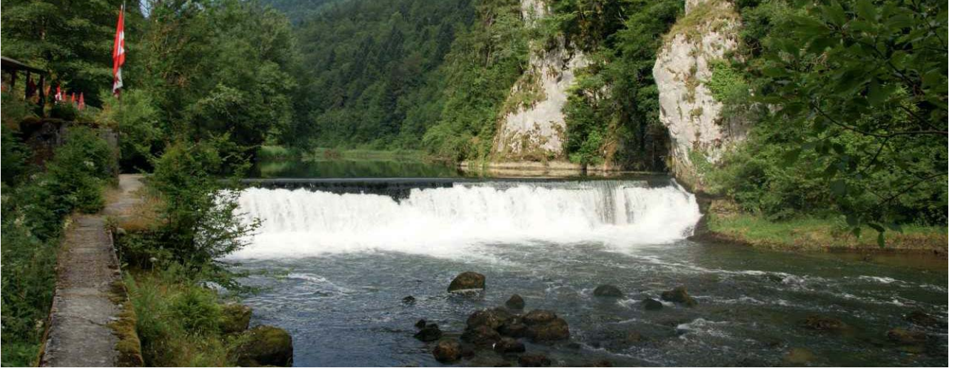
Vue depuis l'aval avec seuil.

9 ONG franco-suisse* demandent de façon urgente à l'État français d'engager la procédure d'acquisition de l'ancien seuil du Theusseret. Elles demandent aussi à l'État de rejeter le projet de microcentrale qui va à l'encontre des décisions prises dans le cadre du Groupe de travail binational.