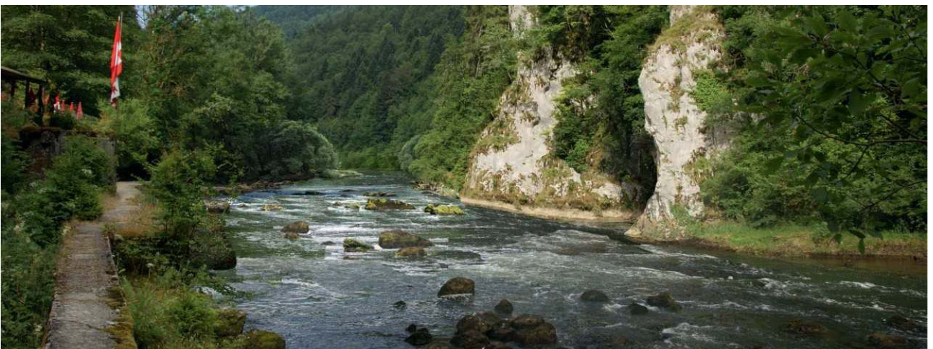
Vue depuis l'aval sans seuil.

* AAPPMA La Franco-Suisse, Fédération de pêche du Doubs, Fédération Suisse de Pêche, ANPER (Association nationale pour la protection des eaux et des rivières), SOS/Loue et rivières comtoises, CPEPESC (commission de protection des eaux nationales), FNE (France Nature Environnement), Pro Natura Suisse, WWF Suisse.