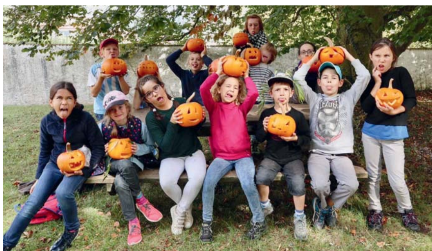
Sensibiliser et émerveiller les jeunes.