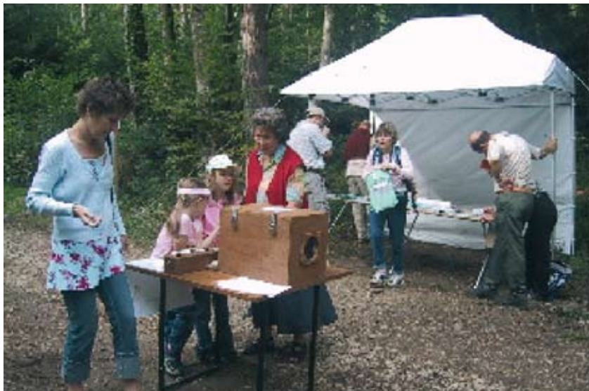
Le stand et la table des senteurs.

Les 23 et 24 septembre 2006, Pro Natura Jura a participé à la Fête de la forêt, organisée par l'Association jurassienne des gardes forestiers. L'aspect « biodiversité de la lisière » a été présenté par la pose de panneaux d'information le long d'un sentier de 1 km environ. Un stand a été monté pour l'information générale sur l'association. Une table des senteurs a permis de discuter avec un grand nombre de marcheurs. Un sentier sensoriel a été aménagé. ■