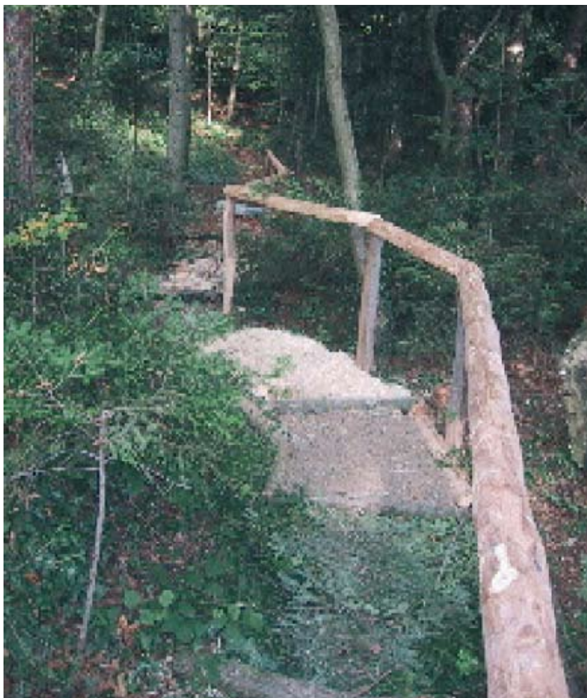
Le sentier sensoriel.

La campagne cantonale a été un succès. Plus de 75 % des Juras siens ont accepté le moratoire. Il s'agit de rester très vigilants car les multinationales n'abandonneront pas ces techniques lucratives. Il serait temps d'interdire les OGM sur sol suisse. Le prochain combat réside probablement dans la lutte de bio-carburants agricoles, grâce à des cultures OGM. Les énergies renouvelables n'ont pas fini de nous étonner et surtout de poursuivre la destruction de la planète. ■