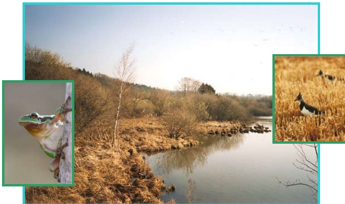
Les étangs de Damphreux : un site d'importance fédérale dorénavant.

La Fondation des marais de Damphreux suit attentivement l'avancement des travaux du remaniement parcellaire. Un projet de réfection de chemins agricoles avec collecteurs d'eau va faire barrière à l'arrivée d'eau dans le marais. Ce que nous redoutions est évident depuis plusieurs années : l'eutrophisation du ma-