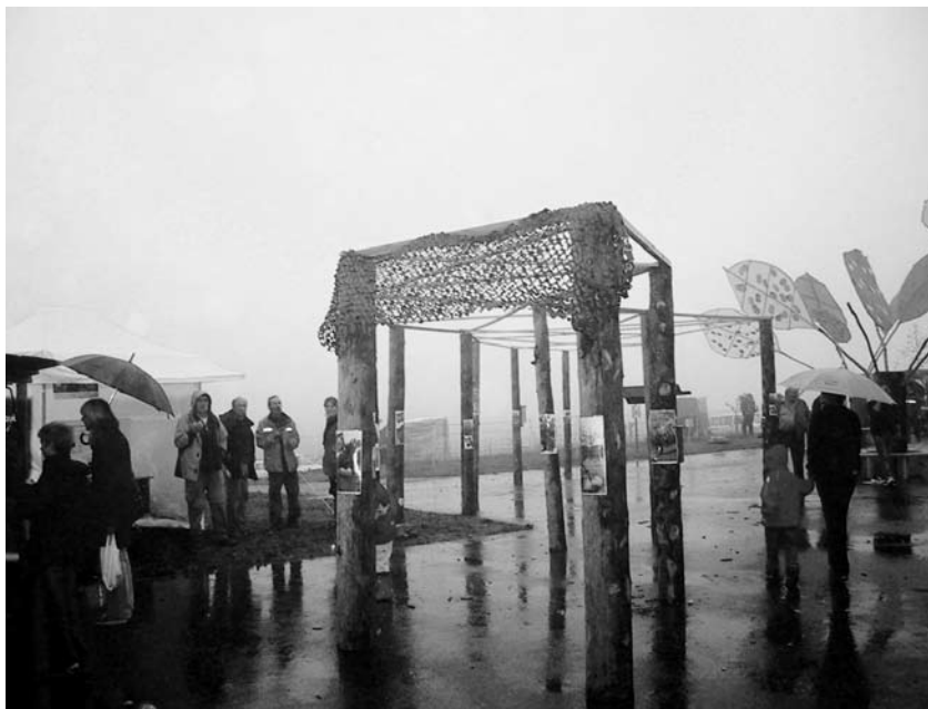
Un verger « virtuel » avec nichoirs et présentation d'essences et espèces.

Sur le thème du « Tutti frutti », les fruits sous toutes leurs coutures ont été présentés les 16 et 17 septembre 2006 au Marché bio de Saignelégier. Pro Natura Jura a décidé, en collaboration avec le Centre nature Les Cerlatez, de présenter la diversité des vergers. C'est une exposition originale sur 25 m 2 qui a permis à de nombreux visiteurs de s'amuser et d'apprendre. Les jeunes ont été enchantés par les jeux et la découverte dans les différents nichoirs des habitants des vergers. ■